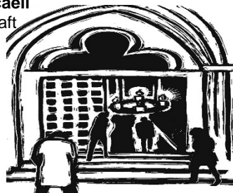
Rorate caeli desuper – Tauet, Himmel, von oben Einladung zur Rorate-Messe